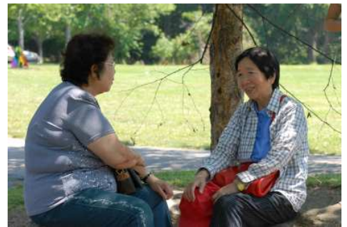
中英文成人主日學有五班