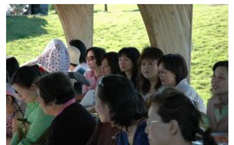
兄弟姐妹們在一起

(7) 6月21日周六，在黑山公園舉行了教會一年一度的野餐活動。有二百多成人和孩子們參加。大家享受和風麗日及與兄弟姐妹們一起燒烤，唱歌，聚餐，談心，散步，划船的樂趣。