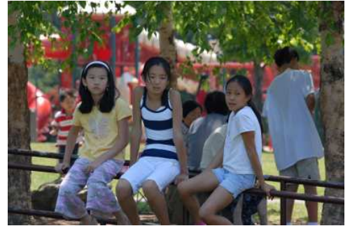
兒童和青少年主日學共七班

“申命記”記載了以色列民在進入迦南應許之地前，摩西向他們傳講的神的話。我們今天學習它，是要明白神的律法，了解神的心意，能不斷順服在神面前，行在神的旨意中，進入神的應許之地，使神得榮耀。