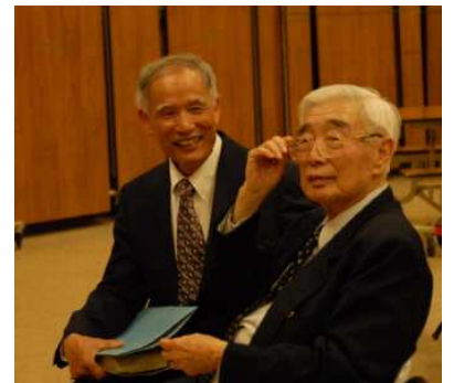
願神祝福他的僕人